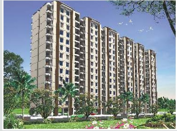
1 BHK Type - B