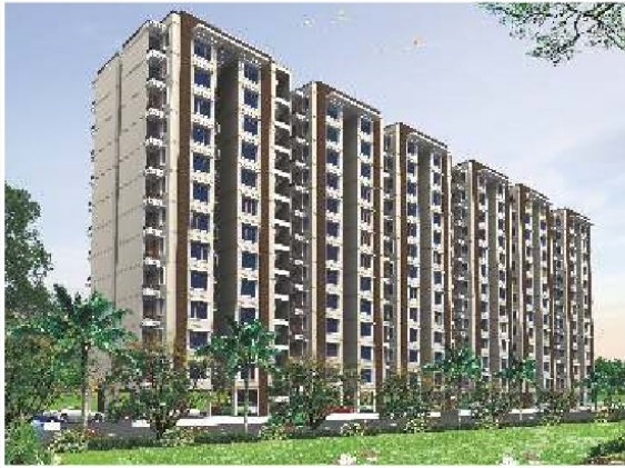
2 BHK Type - A