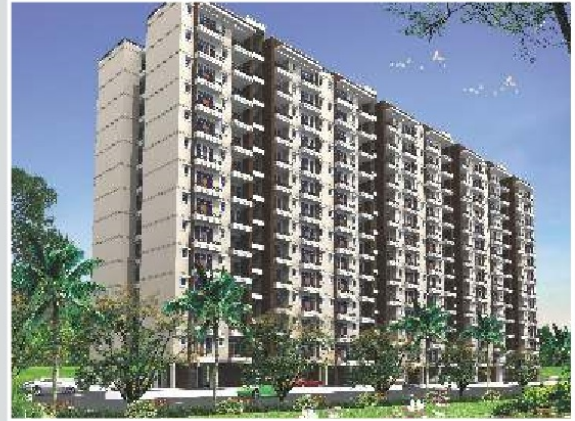
2 BHK (Type-B)