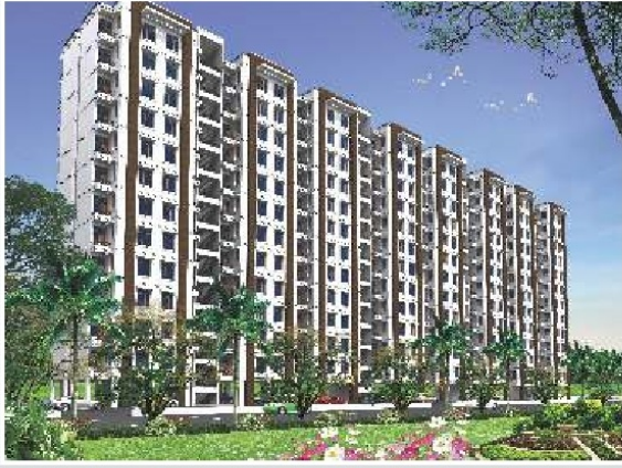
1 BHK Type - A