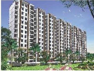
1 BHK (Type-A)