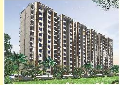
2 BHK (Type-A)