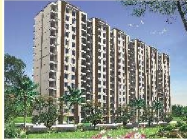
1 BHK (Type-B)