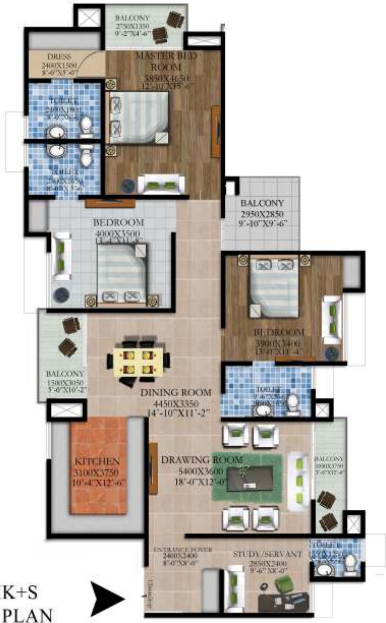
3BHK+S UNIT PLAN

UNIT BUILT UP AREA : 1798.00 SQ.FT. SUPER AREA : 2128.00 SQ.FT.