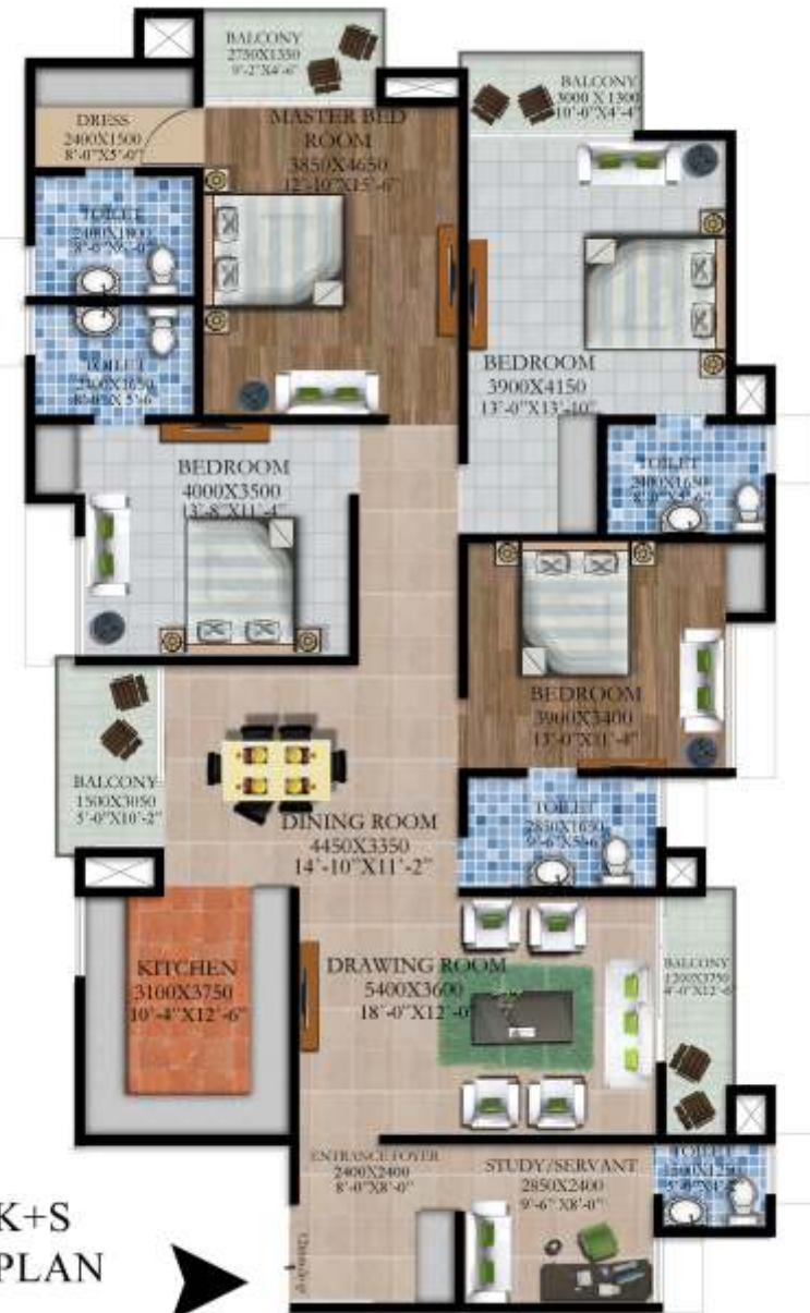
4BHK+S UNIT PLAN

UNIT BUILT UP AREA : 2048.00 SQ.FT. SUPER AREA : 2381.00 SQ.FT.