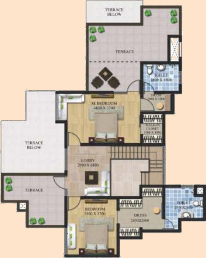
UPPER FLOOR PLAN

TOTAL BUILT UP AREA = 199.74 SQM UNIT SUPER AREA = 229.70 SQM TERRACE AREA = 64.45 SQM