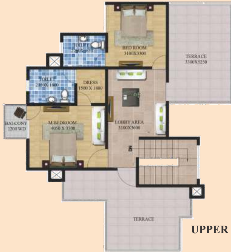
UPPER FLOOR PLAN

TOTAL BUILT UP AREA = 175.10 SQM SUPER AREA = 208.19 SQM TERRACE AREA = 38.69 SQM