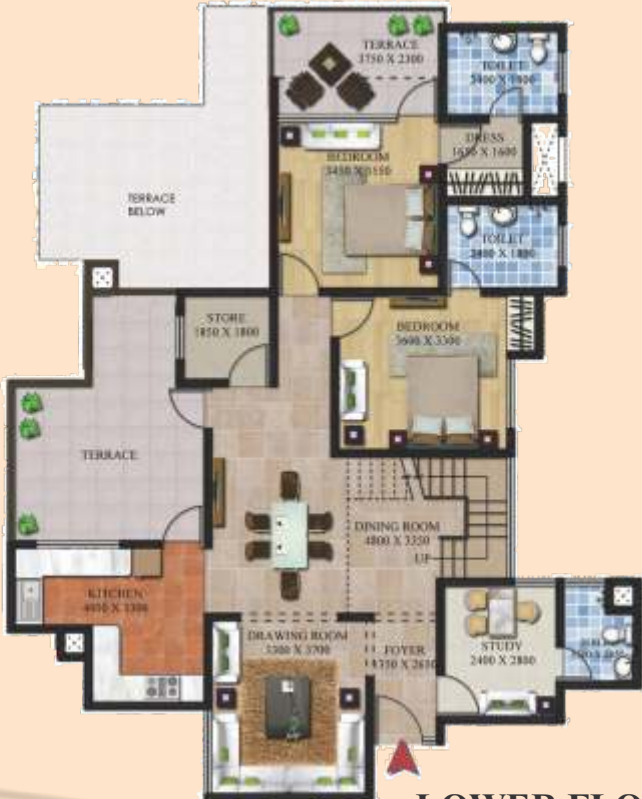
LOWER FLOOR PLAN