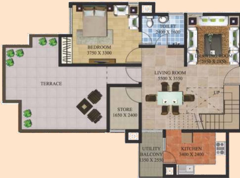
LOWER FLOOR PLAN