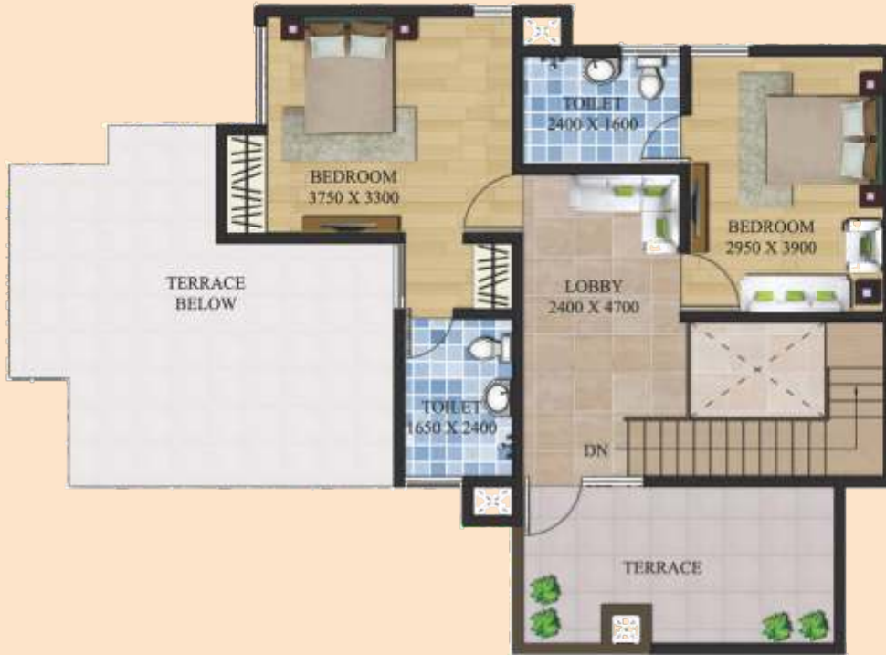
UPPER FLOOR PLAN

TOTAL BUILT UP AREA = 139.21 SQM UNIT SUPER AREA = 166.50 SQM TERRACE AREA = 37.51 SQM