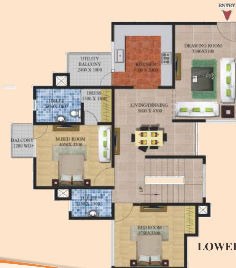
LOWER FLOOR PLAN