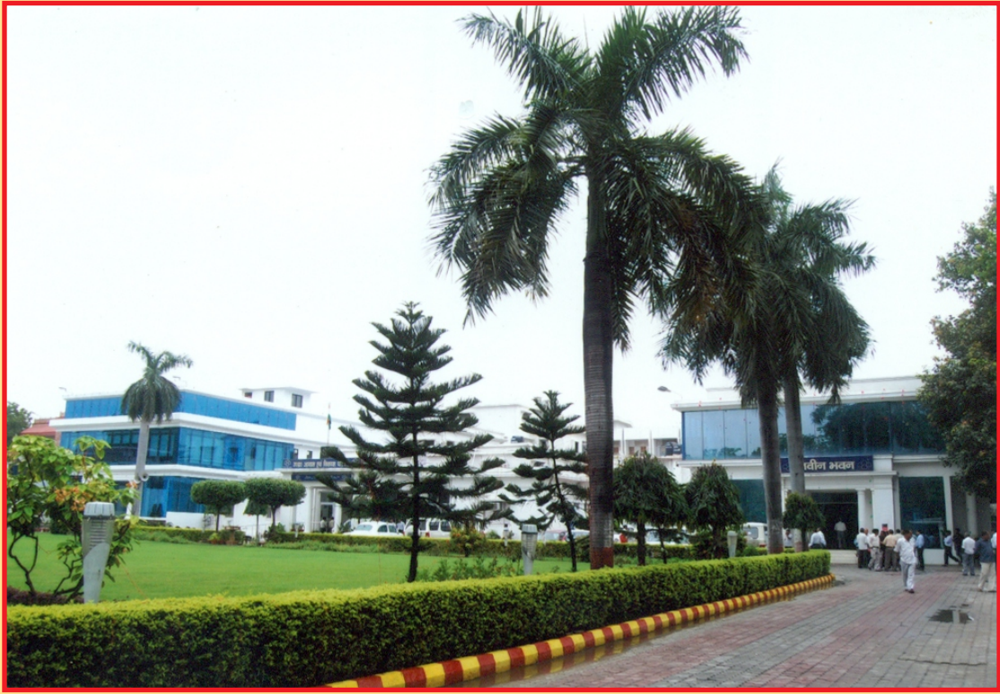
उ.प्र. आवास एवं विकास परिषद, मुख्यालय