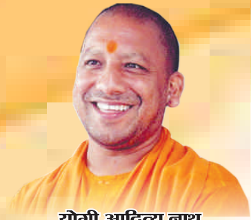
योगी आदित्य नाथ माननीय मुख्यमंत्री, उ.प्र.