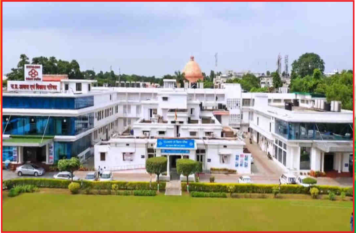
उ.प्र. आवास एवं विकास परिषद, मुख्यालय लखनऊ