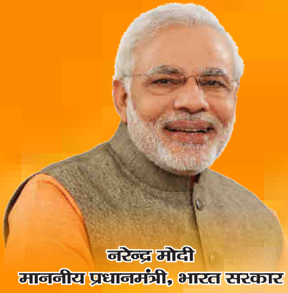
नरेन्द्र मोदी माननीय प्रधानमंत्री, भारत सरकार