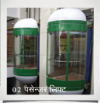
02 पैसेन्जर लिफ्ट